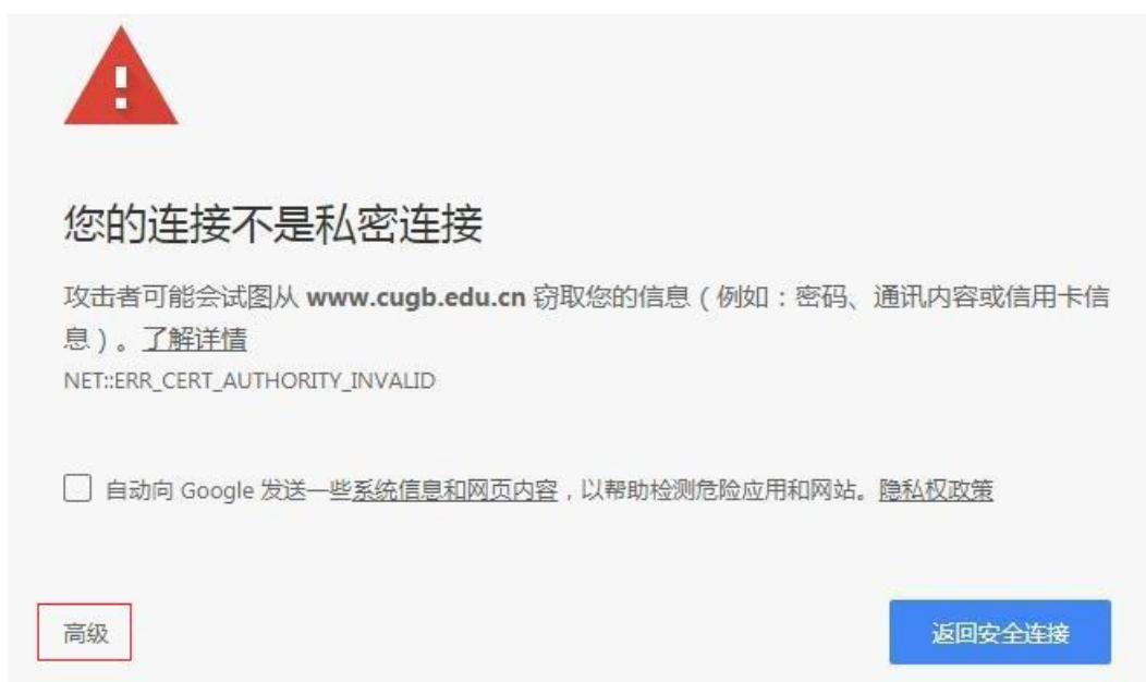
图2 不安全的链接提示

输入用户名、密码并选择登录的校园网内网系统，点击登录。（ 注意： VPN 的用户名密码和数字化校园的用户名密码一致。）由于是安全加密地址，在登录时 部分浏览器 会提示是一个不安全的链接，如下图2所示。