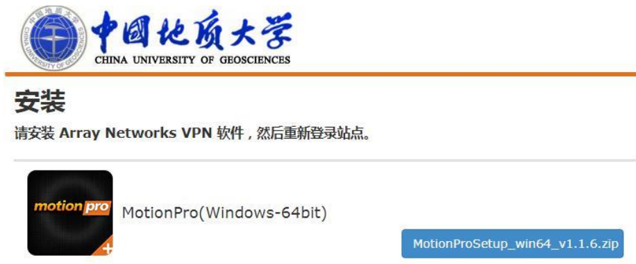
图4 首次登录下载VPN客户端软件

首次登录成功后会提示安装Array Networks VPN 软件 (仅第一次登录) , 如图4所示 :